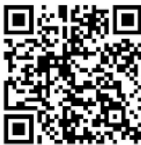
Pastoraat en eredienst